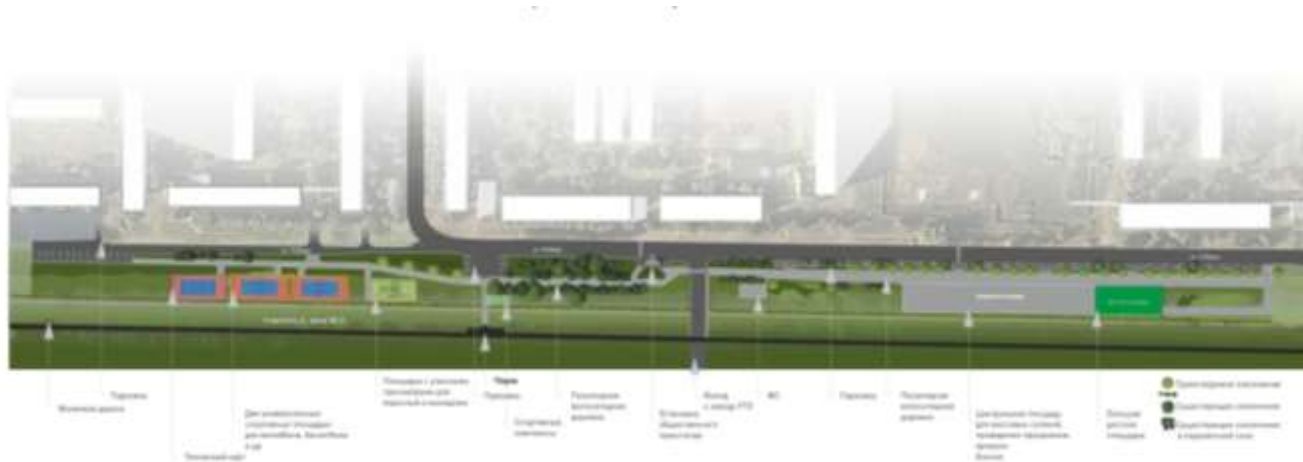
Схема расположения элементов благоустройства прогулочного сквера в Южном районе г. Воткинска